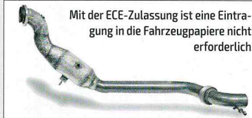
Mit der ECE-Zulassung ist eine Eintragung in die Fahrzeugpapiere nicht erforderlich

führt auch die gesamte Abgastemperatur deutlich schneller aus dem Motorumfeld ab. Die von HJS verwendeten Metallträger sollen für einen sonoren Klang sorgen. Der HJS-Tuning-Kat ist ab sofort erhältlich. www.hjs-motorsport.de