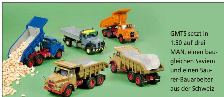
GMTS setzt in 1:50 auf drei MAN, einen baugleichen Saviem und einen Saurer-Bauarbeiter aus der Schweiz