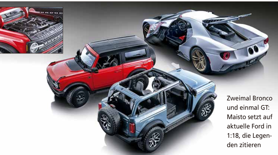
Zweimal Bronco und einmal GT: Maisto setzt auf aktuelle Ford in 1:18, die Legenden zitieren